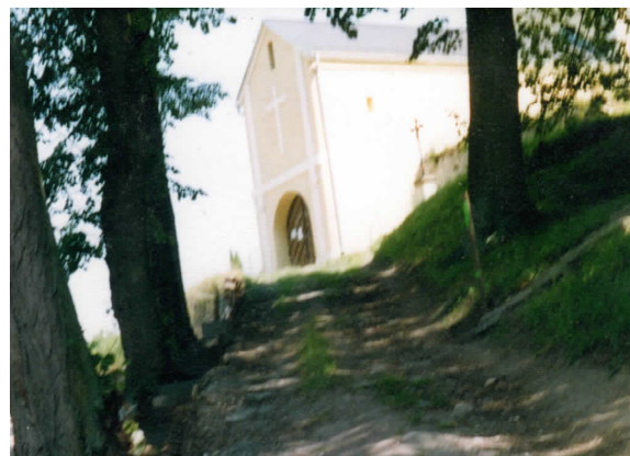
Rekonstrukce kostela v Horní Hynčíně 2003